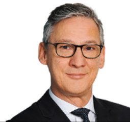
Prof. Dr. Alfred Hagen Meyer meyer.Rechtsanwälte