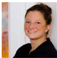
Franca Werhahn meyer.rechtsanwalts- gesellschaft mbH

Aufgrund der steten Aktualität des Themas sollten Sie sich dieses kostenlose Seminar nicht entgehen lassen!